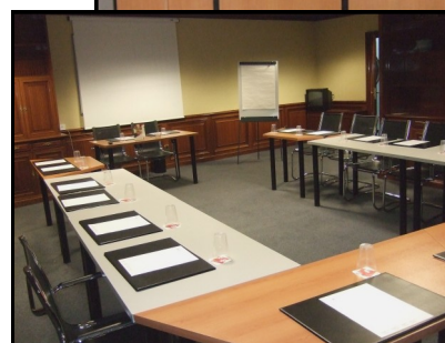
Centro de Negocios AFFIRMA, la nueva alternativa a los negocios del siglo XXI