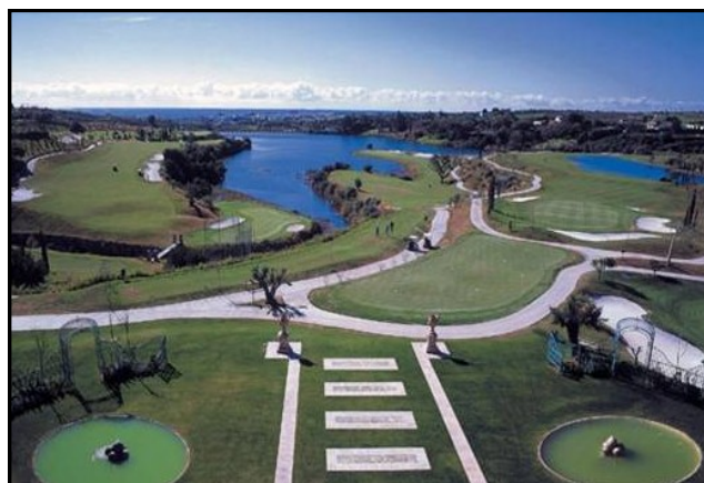
El Campo de Golf Flamingos Hotel Villa Padierna Ritz Carlton, en el que tuvo lugar el evento