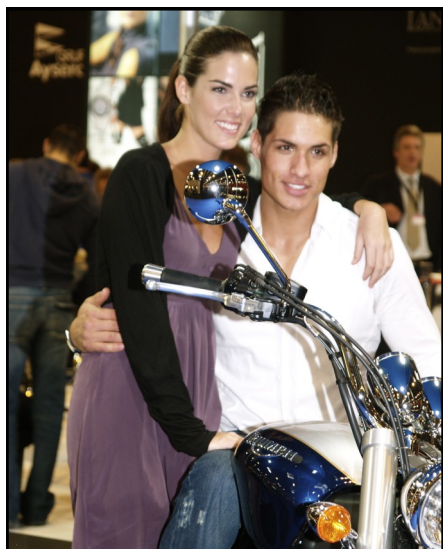
Miss y Mister España sobre una de las motos Triumph en la concentración

O.P.C. ha reunido a los propietarios de motos Triumph para celebrar el lanzamiento de la primera colección de relojes de la marca en España.